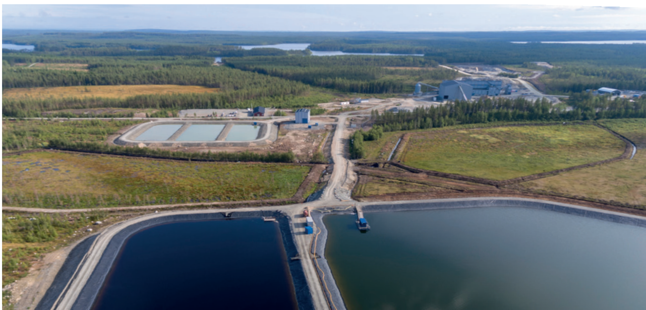
Naturbild över området kring gruvan.

Betald likvid som ej tagits i anspråk kommer i så fall att återbetalas. Tecknaren bör ha ett värdeandelskonto i en finsk eller i Finland verksam kontoförvaltare, och teckningsuppdragsgivaren bör meddela värdeandelskontots nummer i uppdraget för teckning. Personsignum, värdeandelskontots nummer och andra för uppdraget nödvändiga personuppgifter kan överlämnas till andra parter som deltar i uppdragets eller uppgiftens förverkligande.