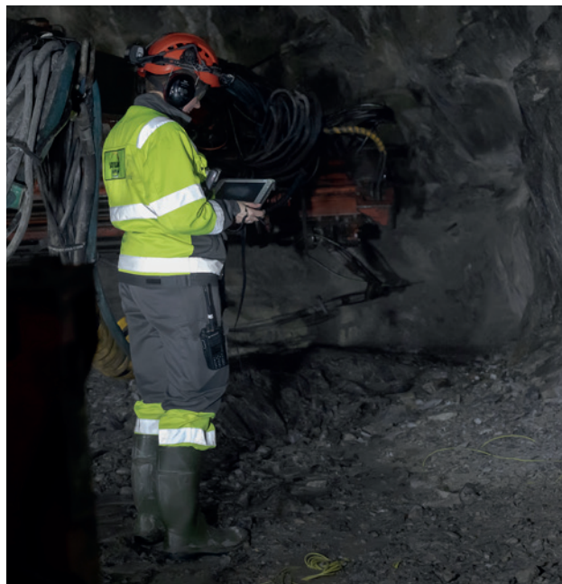
Bild på gruvanständts utförande av arbete i silvergruvan.

Av den totala konsumtionen av silver svarar industriell tillverkning för cirka 50 procent, bestick och smycken för cirka 25 procent samt mynt och tackor för resterande cirka 25 procent. 5 I tabell 4 nedan redogörs för efterfrågan på silver fördelat på industri, smycken, investeringar och övrigt under perioden 2012–2022 per den 17 november 2022.